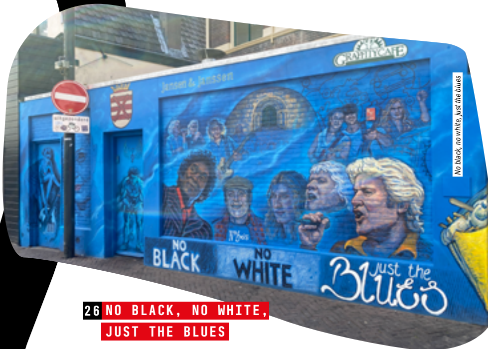
No black, no white, just the blues