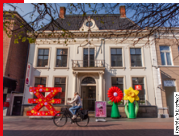
Tourist Info Enschede

Dit is het startpunt van de street art route.