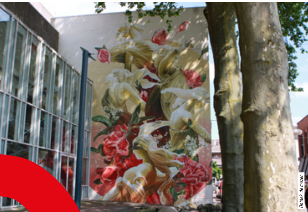
Ontdek de muzen